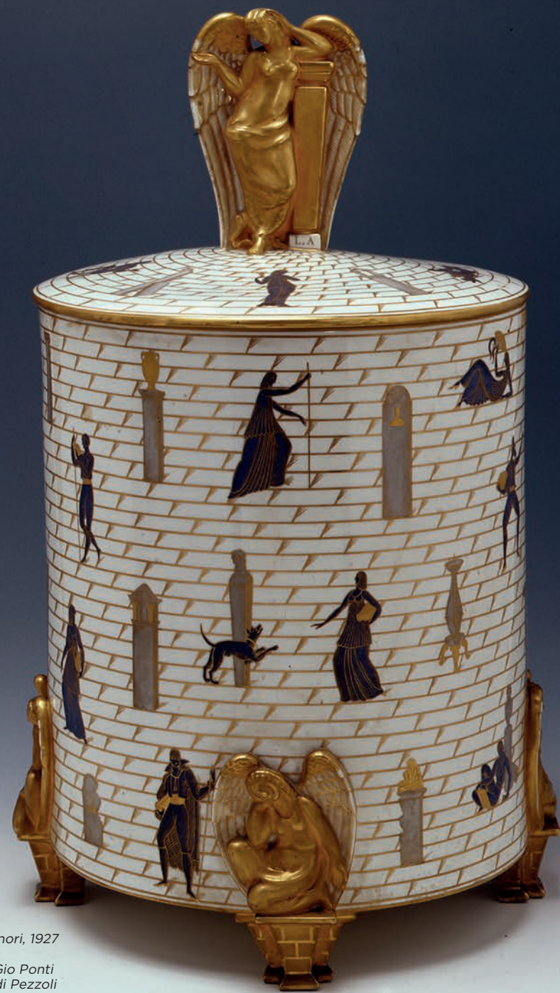
Cista Doccia, Richard Ginori, 1927 Porcellana dura Libero Andreotti, Gio Ponti Milano, Museo Poldi Pezzoli